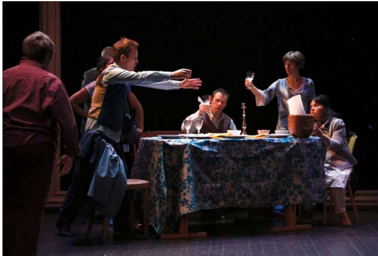
Les dix acteurs des fileuses, la porte et le messager sont en situation de handicap mental.

Les fileuses, la porte et le messager, c'est la nouvelle pièce du Théâtre de l'Esquisse. Mise en scène par Gilles Anex et Marie-Dominique Mascrot, la troupe genevoise se produit sur scène depuis 1984.