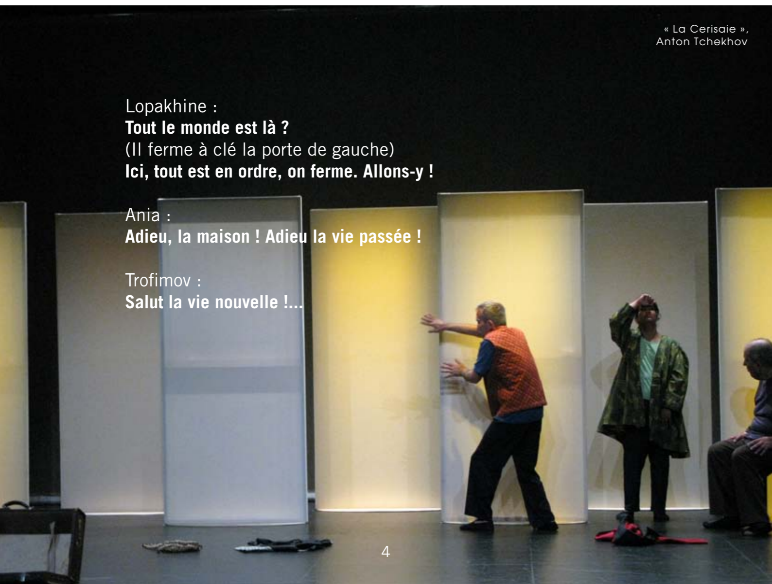
« La Cerisaie », Anton Tchekhov

Film « Hélas pour moi » de Jean-Luc Godard