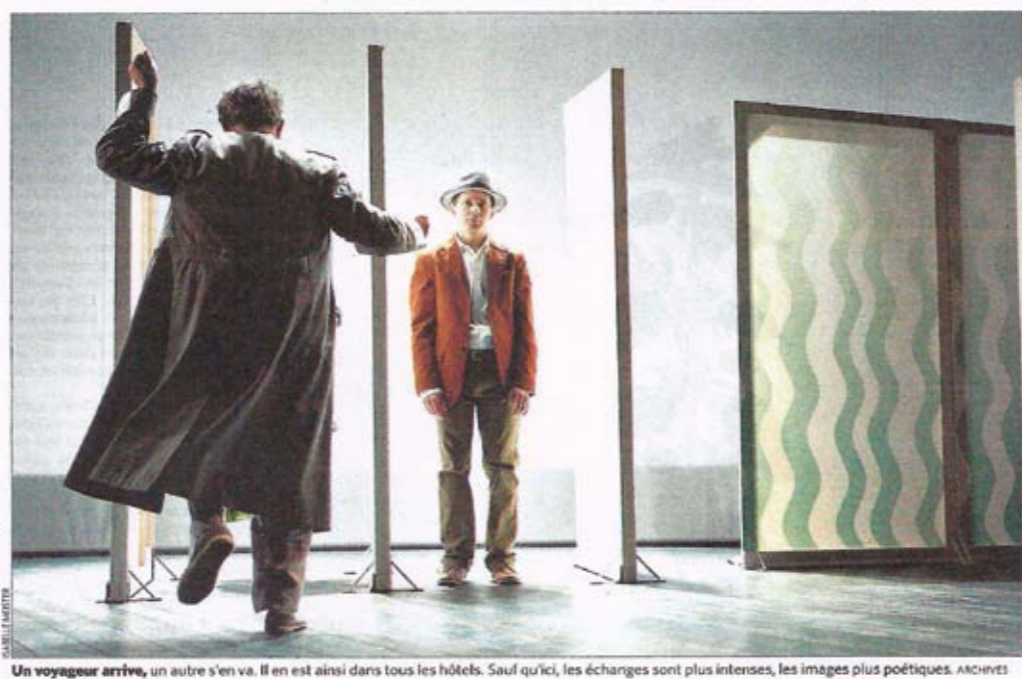
Un voyageur arrive, un autre s'en va. Il en est ainsi dans tous les hôtels. Sauf qu'ici, les échanges sont plus intenses, les images plus poétiques.